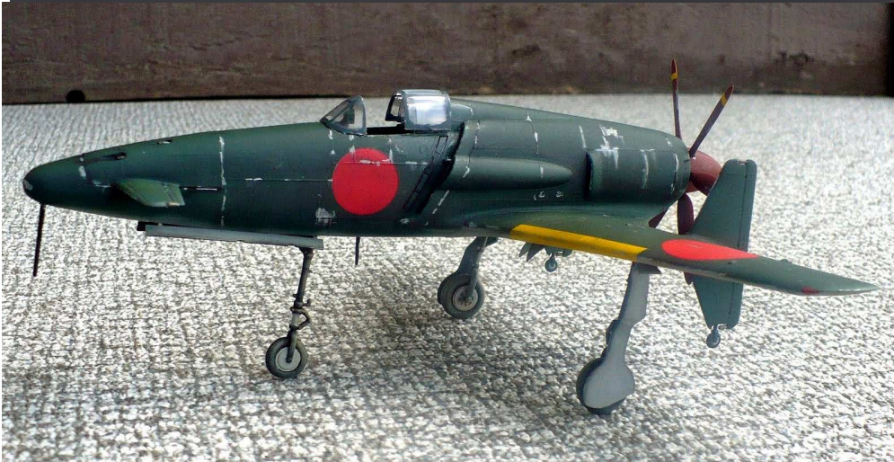
nicht mehr geplante J7W2 Shinden mit Düsentriebwerk als Modell